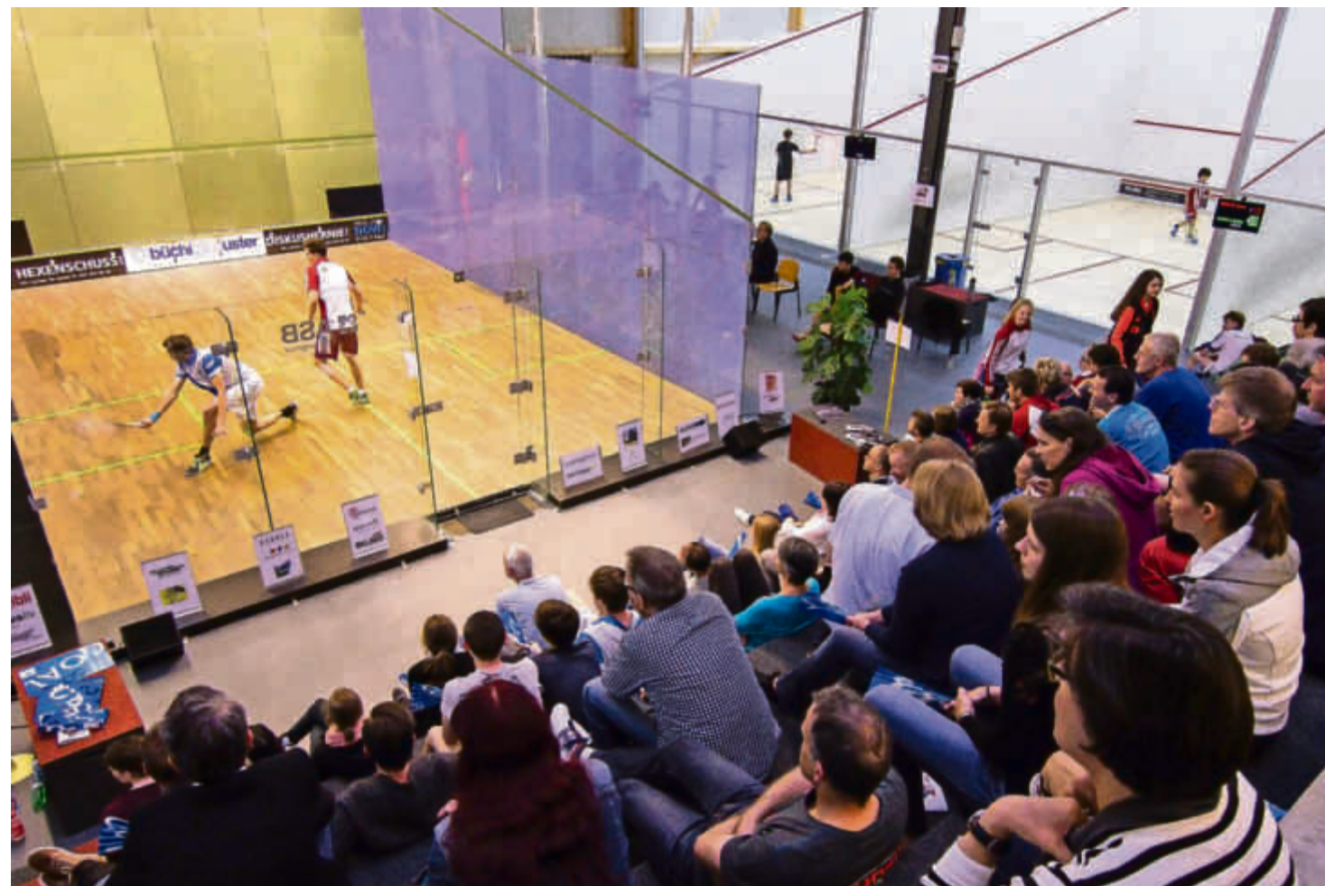
Grossaufmarsch in der Ustermer Squash-Arena: Vor vollen Rängen wurden in Uster die NLA-Finalturniere ausgetragen. Zum Heimsieg reichte es aber nicht: Sowohl die Männer als auch die Frauen des Squashclubs Uster verloren ihren Final. SEITE 27